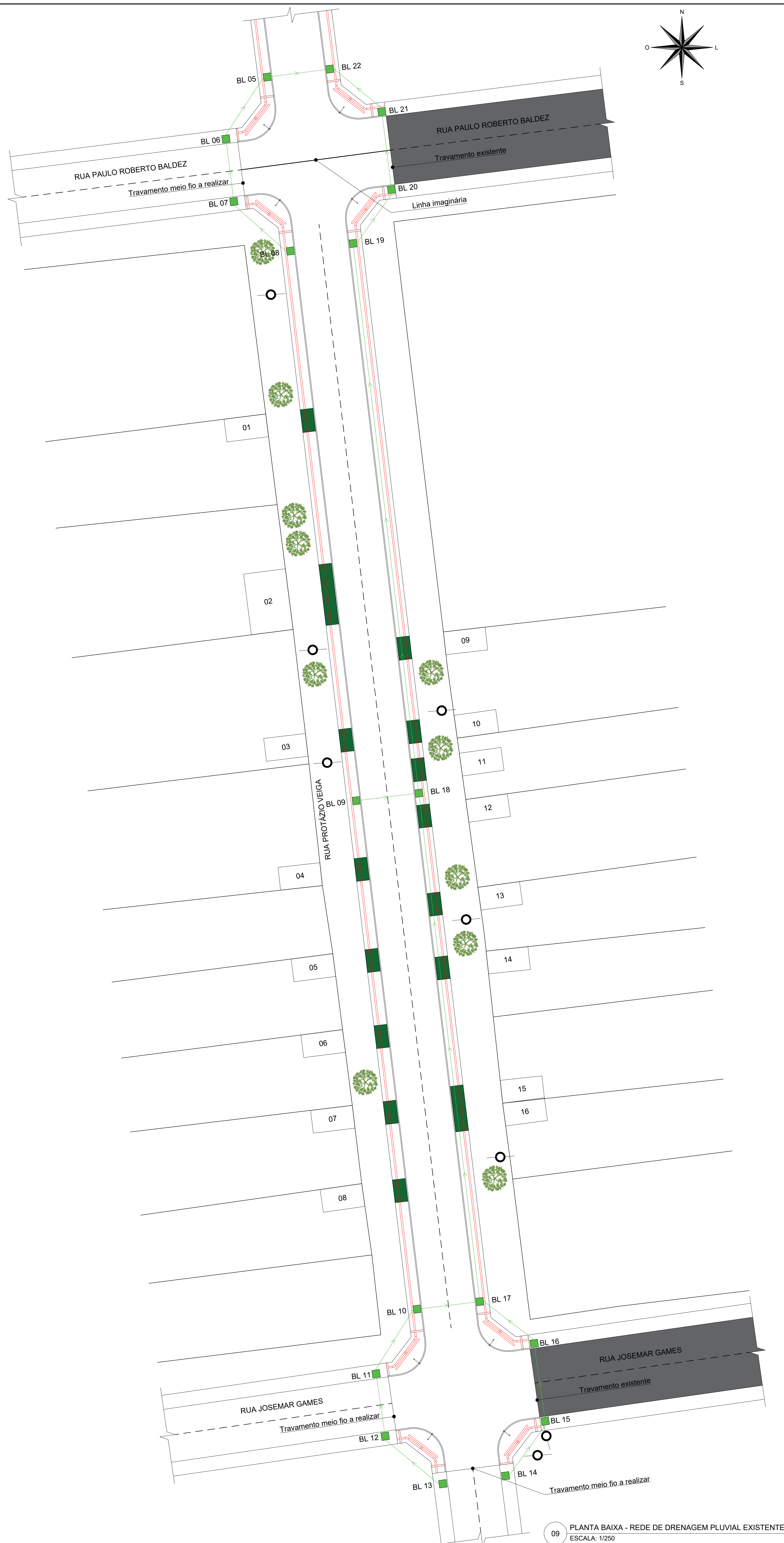
09 PLANTA BAIXA - REDE DE DRENAGEM PLUVIAL EXISTENTE ESCALA: 1/250