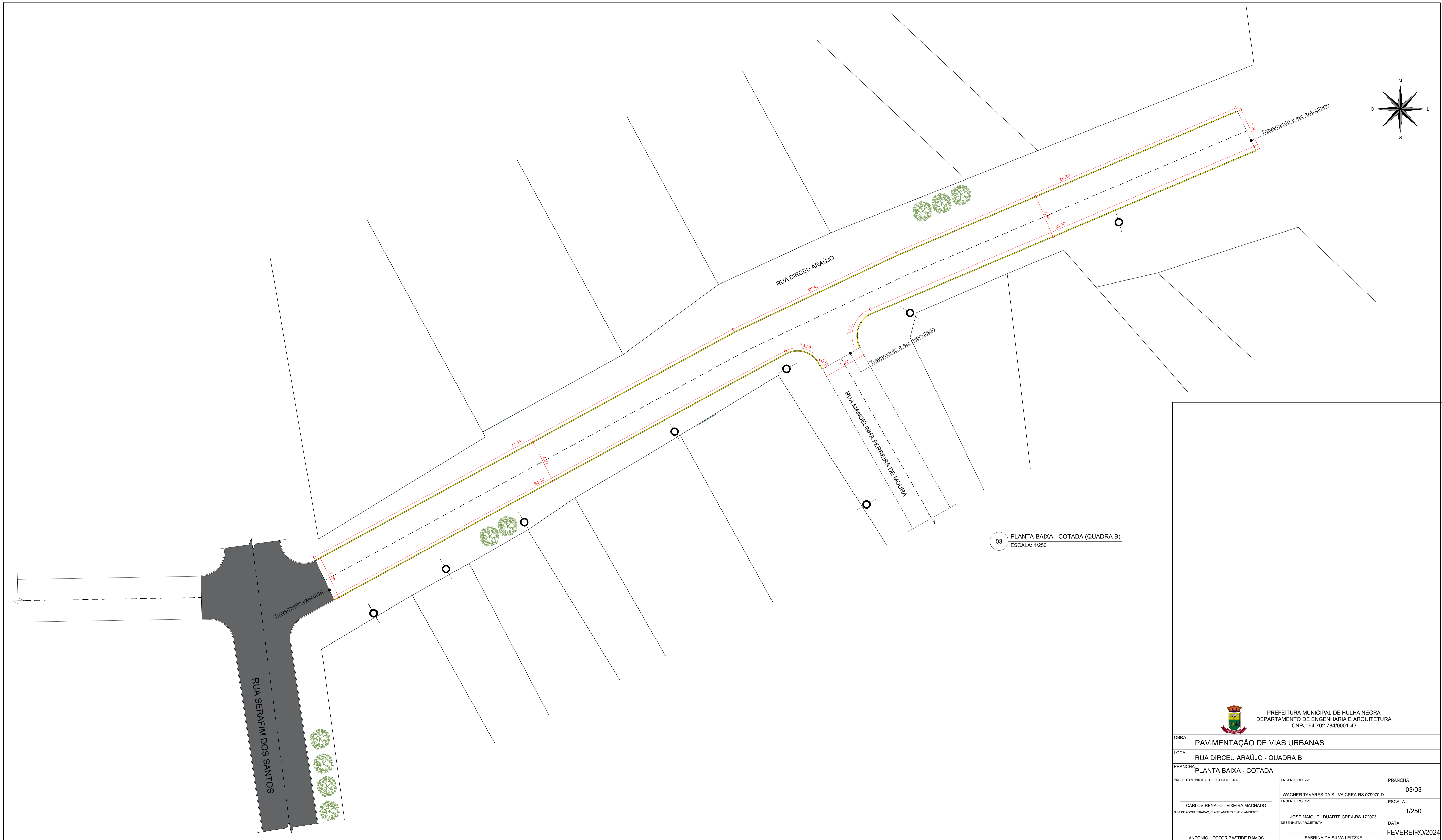
03 PLANTA BAIXA - COTADA (QUADRA B) ESCALA: 1/250