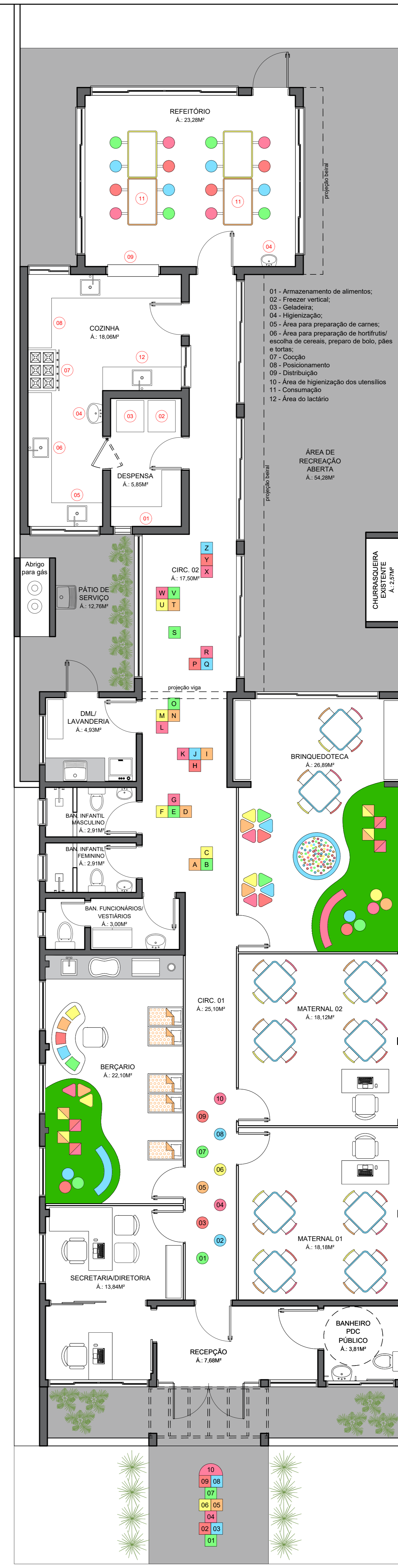
07 PLANTA BAIXA MOBILIADA ESC. 1:50